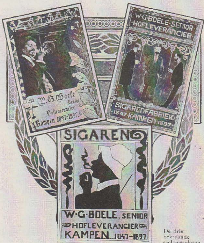
De drie bekroonde reclame-platen.

aantal andere filialen in de meeste andere grote plaatsen van Nederland. Naast deze magazijnen werden ook een aantal depots gevestigd waar uitsluitend sigaren van W.G. Boele te verkrijgen waren. Tevens werd er aan de overzijde van de Hofstraat in Kampen een nieuwe ruime fabriek in gebruik genomen.